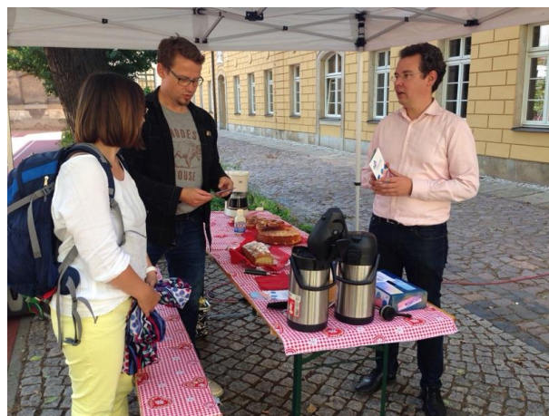
Im Gespräch mit Eltern am Tag der offenen Tür.

Mit einem kleinen Infostand hat sich unser Förderverein am diesjährigen Tag der offenen Tür im August beteiligt. Vor dem Schulgebäude konnten wir bei schönem Wetter, selbstgebackenem Kuchen und Kaffee mit interessierten Eltern, aber auch mit den Lehrern der Schule ins Gespräch kommen und natürlich für den Verein werben. Zwar hat sich unser Engagement noch nicht direkt durch neue Mitgliedschaften ausgezahlt, doch sehen wir den Tag der offenen Tür weiterhin als wichtige Plattform, um den Verein und seine Anliegen in breiterem Maße vor allem bei der zukünftigen Elternschaft bekannt zu machen. Der Vorstand möchte sich natürlich an dieser Stelle bei allen bedanken, die durch Kuchenspenden oder auch mit der Bereitstellung unserer Standausstattung zum Gelingen beigetragen haben.